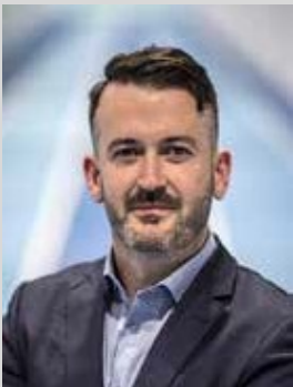
Donal Óg Cusack

Tá Liam Sheedy ina Bhainisteoir Réigiúnach le Banc na hÉireann. D'imir sé le foireann iomána Thiobraid Árann agus bhuaigh sé Craobh Mionúr Uile-Éireann mar bhainisteoir ar an gcontae sa bhliain 2006. Bhuaigh sé an tSraith Náisiúnta uair amháin agus Craobh na Mumhan dhá uair ar leibhéal sinsir sular bhuaigh sé Craobh Uile-Éireann sa bhliain 2010. Tá sé ina anailísí iomána ar The Sunday Game ar RTÉ freisin. Bhí Liam ina chomhalta boird de Chomhairle Spóirt na hÉireann.