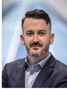
Donal Óg Cusack