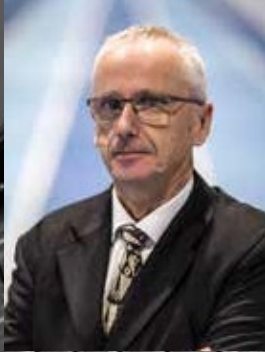
John Treacy Príomhfheidhmeannach

Is é seo an chéad tuarascáil bhliantúil ó Spórt Éireann don tréimhse trí mhí dar críoch an 31 Nollaig 2015.